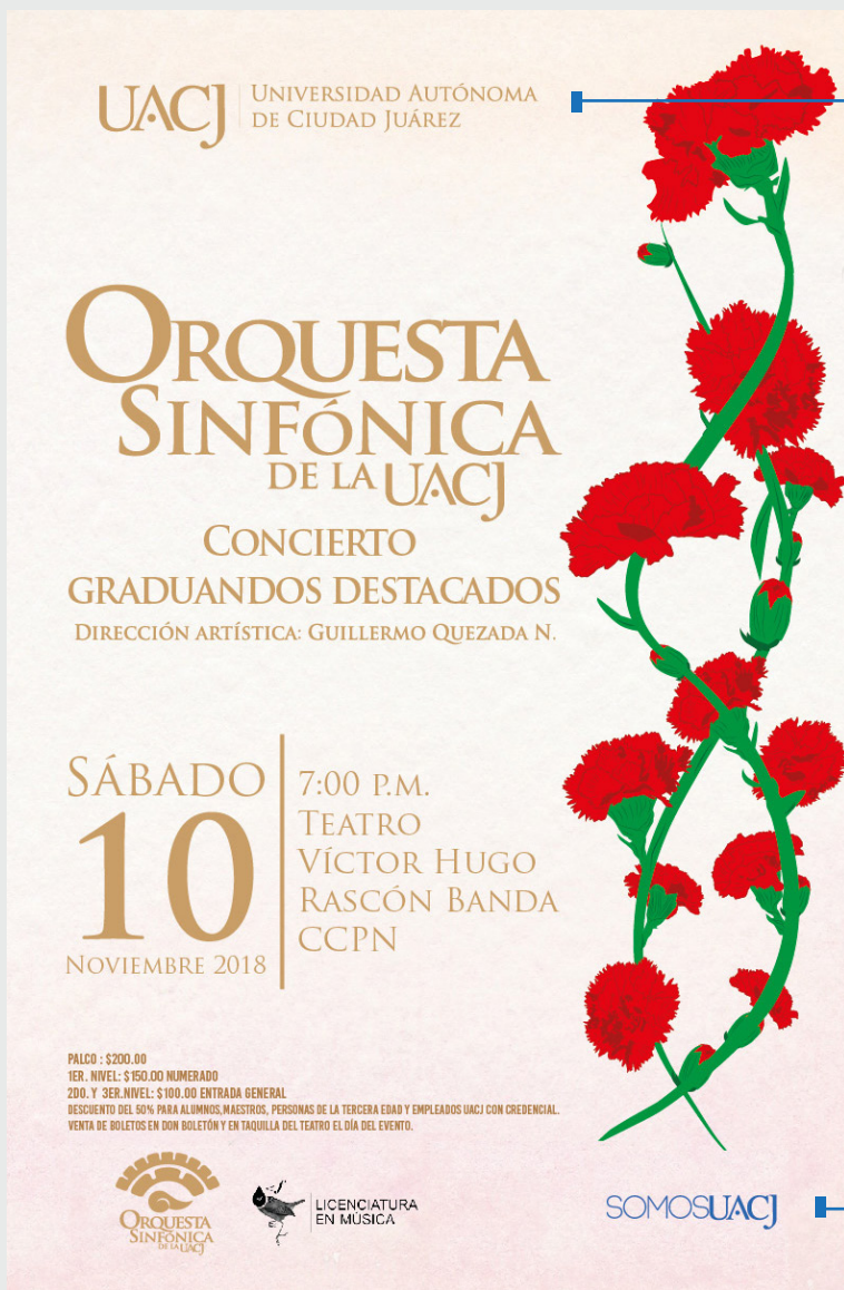
■ Ejemplo 1

Cuando ya se tiene un diseño previo se integrará el logo Somos UACJ.