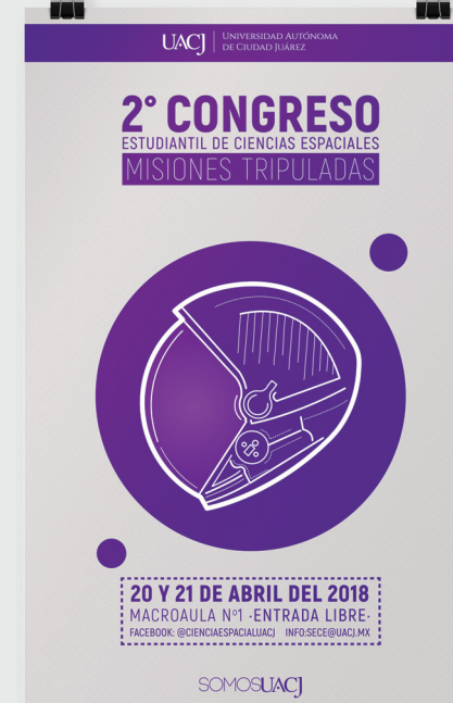
■ Ejemplo 3

Los logos deben de ir acomodados como en el ejemplo 2, pero si el diseño lo requiere puede ir centrado, ejemplo 3.