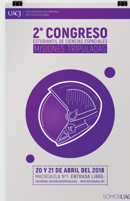
■ Ejemplo 2

El logo institucional siempre deberá tener mayor peso visual.