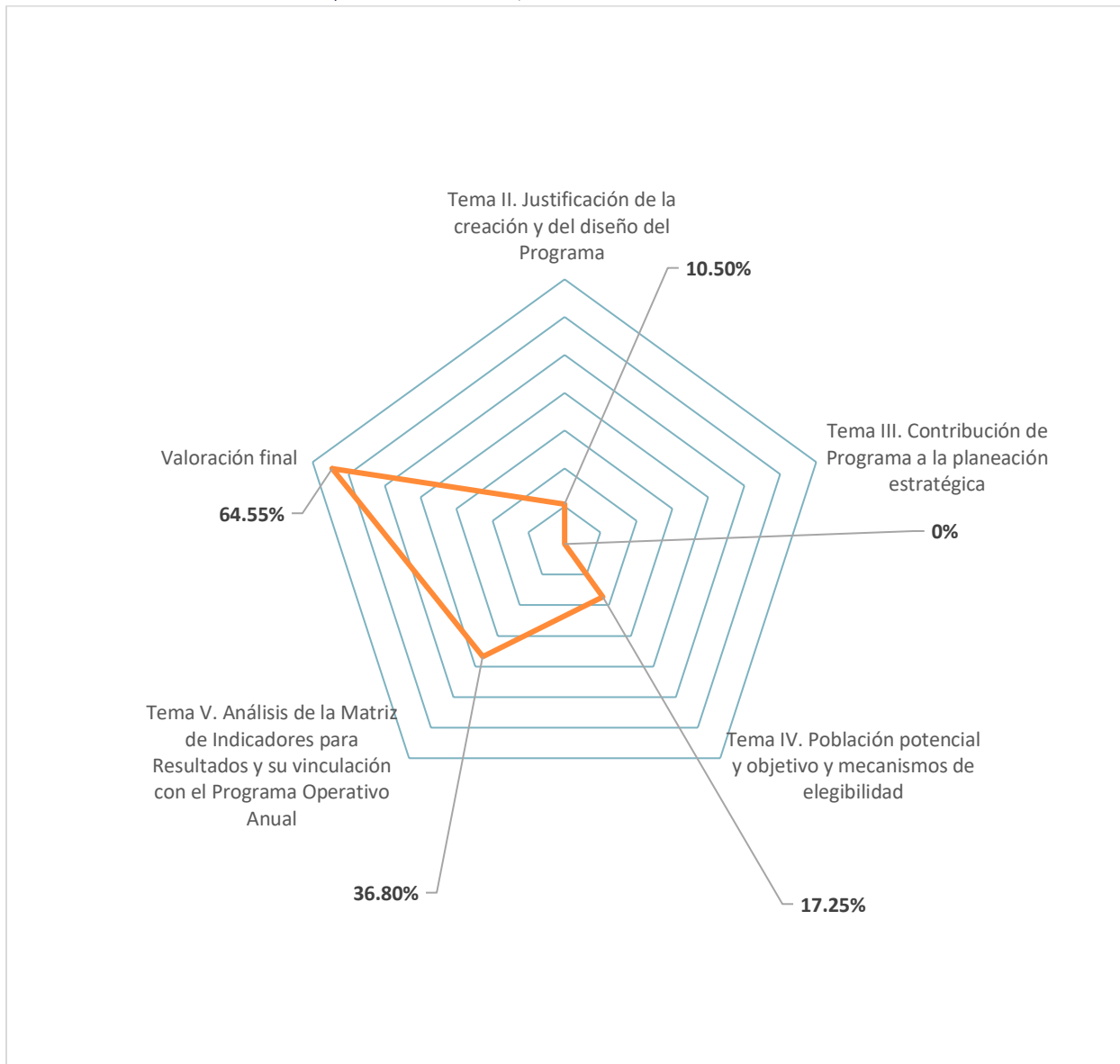
Gráfico 1. Valoración cuantitativa por tema evaluado, 2023.